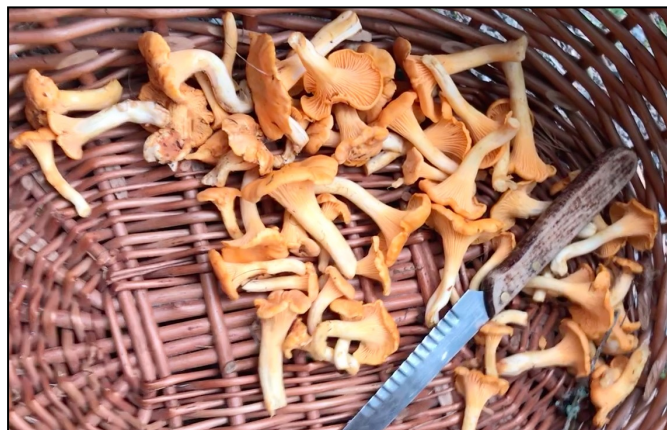
Ett föredrag av en svampexpert, vore det något att satsa på? Bara som exempel

Men vem vet, kanske det till hösten startar någon studiecirkel i något spännande ämne till följd av att vi tog hit någon inspiratör i just det ämnet!