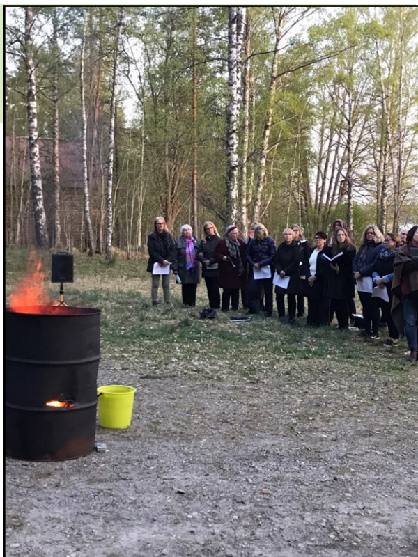
Oljetunna låter så trist. Kalla det hellre lägereld.