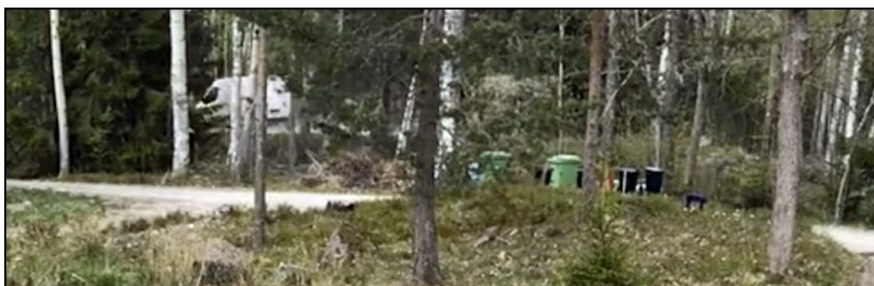
Här hann inte kameran upp förrän skåpbilen hunnit iväg. Men telefonen vet när och var bilden togs