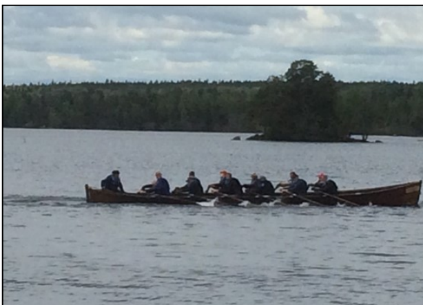
Roddtävling, Engelsbergarna mot Söderbärke