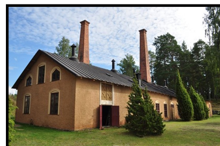
Spelplats i sommar

Antal deltagare är begränsat till runt 30 personer, så skynda att köpa biljetter på Turistcentrum i gamla Brukshandeln.