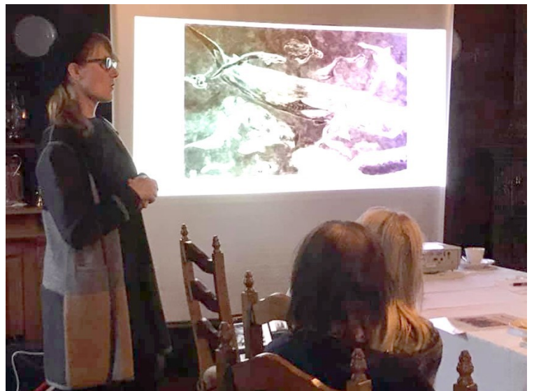
Stinas stora dukar imponerade

På årsmötet avslöjades också årets tema i parken som är Djuriskt: Djur, människa och natur i samverkan.