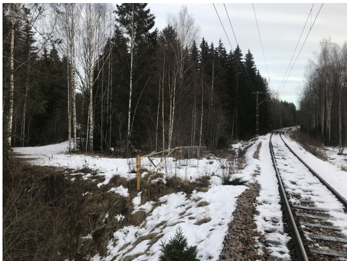
Gamla övergången vid Hydro: vägen till framtidens ställplatser?

Större befolkningstal skulle rimligen bli en ögonöppnare för Fagerstas politiker. Så har samtalet i gruppen förts, och för att komma dit finns bara en väg att gå: att kontakta kommunen för att få alla tillstånd. I första hand tjänstemän ansvariga för näringsliv och planering. Vilket också skett.