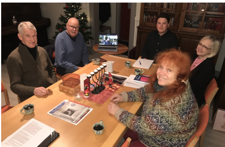
När Framtidsgruppen mötte kommunen: