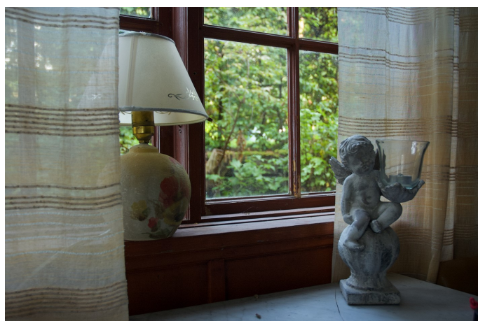
Outnyttjade hus i bygden. Exempel inifrån Elimkapellet