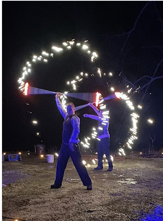
Fackeldans i januarimörkret. Gycklargruppen Trix från Västerås hade bokats av Konstgillet, Musik o Kultur i samarbete med studieförbundet Sensus.

Men först blir det Valborgsfirande sista april med Brakeless och kyrkokören som välkomna medverkande.