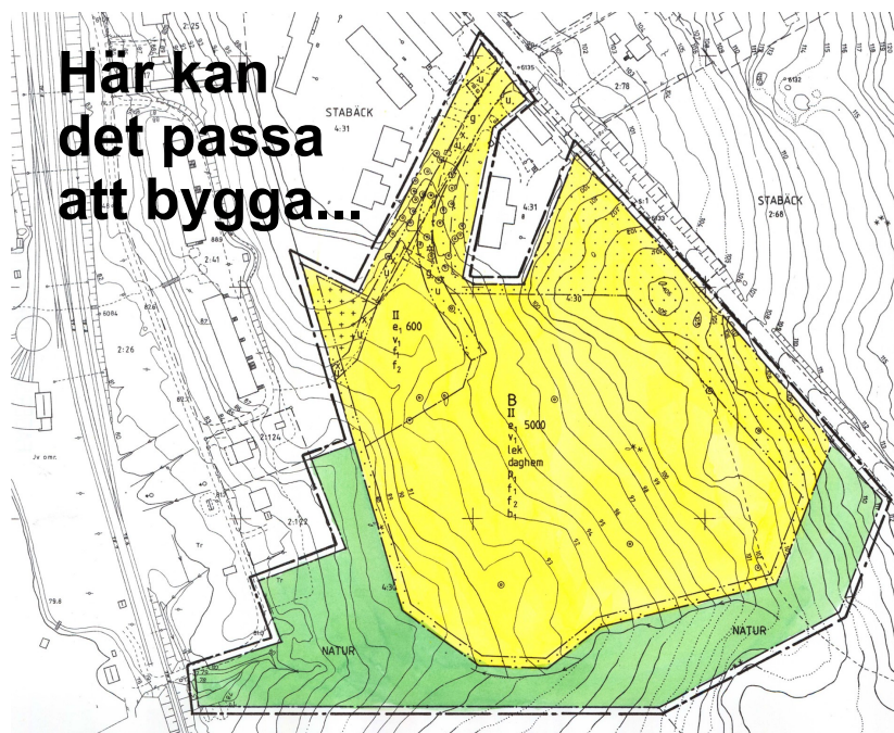
Marken söder om Nyhem ägs av kommunen. Framtidsgruppen siktar på bygglov för nya bostäder. Se nästa sida