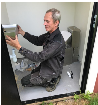
Bosse från NVK sätter upp grejorna .