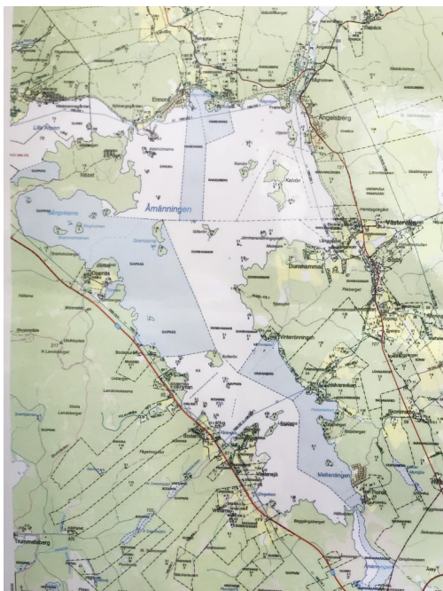
Karta över fiskeområden i Åmänningen, detsamma som Lantmäteriets ordinarie fastighetskarta. Man ser att fastighetsgränserna sträcker sig ut i sjön. www.lantmateriet.se