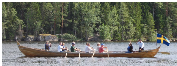
Bilden visar kyrkbåten när den just lämnar Djupnäs för några år sedan