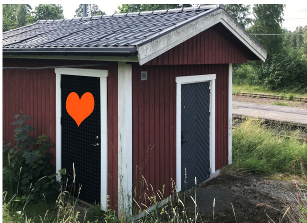
Det lilla röda huset på stationsplan . Bilden är bearbetad av redaktionen

Innanför dörren på ett litet rött hus vid stationen, har det i 25 år funnits en fullt fungerande kommunal toalett. Det framkom 2018 när kommunens NVK började mäta om det kunde gå att koppla av-lopp från stationshuset.