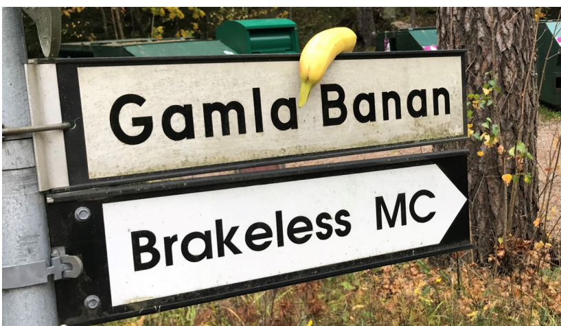
Det bara hampade sig så att en gång hade någon lagt en gammal banan på skylten Gamla Banan. Bilden är INTE arrangerad av redaktionen!

Den skulle då utgå från bruket, fortsätta längs Snyten, över stambanan och vidare norrut förbi Ingebo mot Norbergsbygden. I Högfors möter sedan Norbergs "Benningeleden".