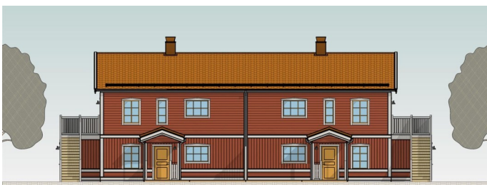
Exempel på en hustyp som skulle kunna bli aktuell. Fyra treor i en kropp. Finns att se på riktigt, i ett Dalarna nära dig.

Men det senaste kanske är allra viktigast: Hur leds projektet? Markfrågor, tillstånd, infrastruktur, finansiering, boendekvalitet m.m. Det behövs ett bostadsutvecklingsbolag. Föreningen har hittat ett som verkar passa in väl, nämligen Sakofall AB i Ludvika. Deras hemsida anbefalles: www.sakofall.se . Där talas om behovet av bostäder på mindre orter och i landsbygd. Om vackra bostäder på vackra platser och om valmöjligheter för den som vill sälja sin villa. Vi vet inte om det blir just det bolaget som ska hjälpa Ängelsberg att utvecklas, men i skrivande stund ser det intressant ut!