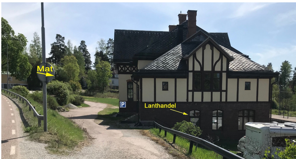
När som helst på dygnet. Med det sortiment som kunderna och butiksansvariga lokalt kommer överens om. Bilden är ett fantasimontage (än så länge).

Det kan tilläggas att sortimentet bestäms helt lokalt. De produkter som bolaget rekommenderar, javisst, men också vad helst som drivarna önskar, inklusive lokalt producerade varor.