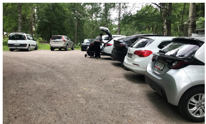
Fullt, nästan trångt är det vid Skulpturparken en vanlig lördag i juli. Parken är en lockelse skapad av ideella krafter