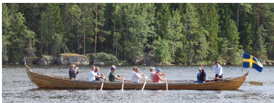
Kyrkbåten vid Djupnäs. Foto: Britt-Marie Philip. Bilderna publicerade även 2022.