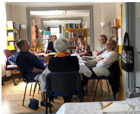
Från Oljeöns vänner "gravöl" i juli

Nu har tiden runnit ut för föreningen Oljeöns vänner. Det finns inte förutsättningar för fortsatt ideellt engagemang på ön som ägs av bolaget Preem. Föreningens tankar om ett samlings- och besöks hus i gamla bostaden har gått om inte på grund av hårda brandskyddsbestämmelser. Bland annat krävdes en för föreningen oöverkomlig investering i form av en brandtrappa på husets baksida. Utan trappa, ingen möteslokal. Bolaget så väl som kommunen, som arrenderar ön, såg inget skäl att de skulle vara med ekonomiskt i en sådan säkerhetsdetalj. Servicen med besök med guide kommer fortsätta, men utan framtid för ideellt engagemang