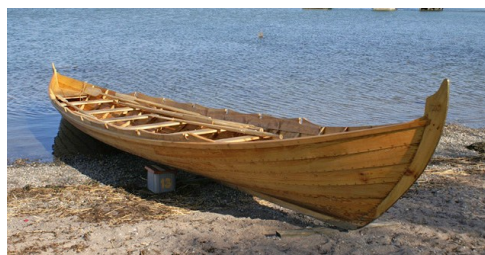
På stranden vid Stensunds Folkhögskola i väntan på transport till Ängelsberg. Maj 2009.

Varannan onsdag är det rodd i kyrkbåt för den som vill. Samling 18.30 vid stationen. Deltagarna bestämmer själva längden på kvällens åkande. Första tillfälle den 2:a juli blev det inte full besättning, men den 16:e och därefter? Kommer du?