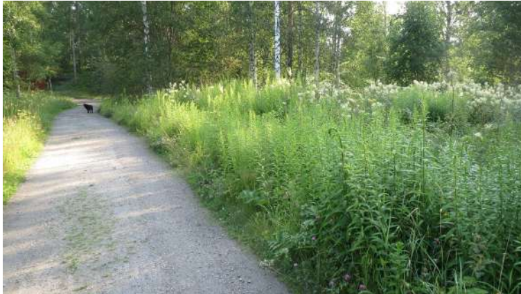
Det finns gott om Kanadensiskt gullris längs Tallbovägen och Gamla Banan förbi Bruket. Det man avverkar får inte komposteras!

Inget område är skonat. Hela Sverige är drabbat, och Ängsbergsbygden är inget undantag. Man ser dem på många ställen, och frågan är bara hur man blir av med dem, eller i vart fall kontrollerar dess utbredning. Vi talar om invasiva växtarter, och frågan har aktualiserats av boende på Tallbovägen. Där finns Kanadensiskt gullris i överflöd. Det vet Jonas Lilja berätta.